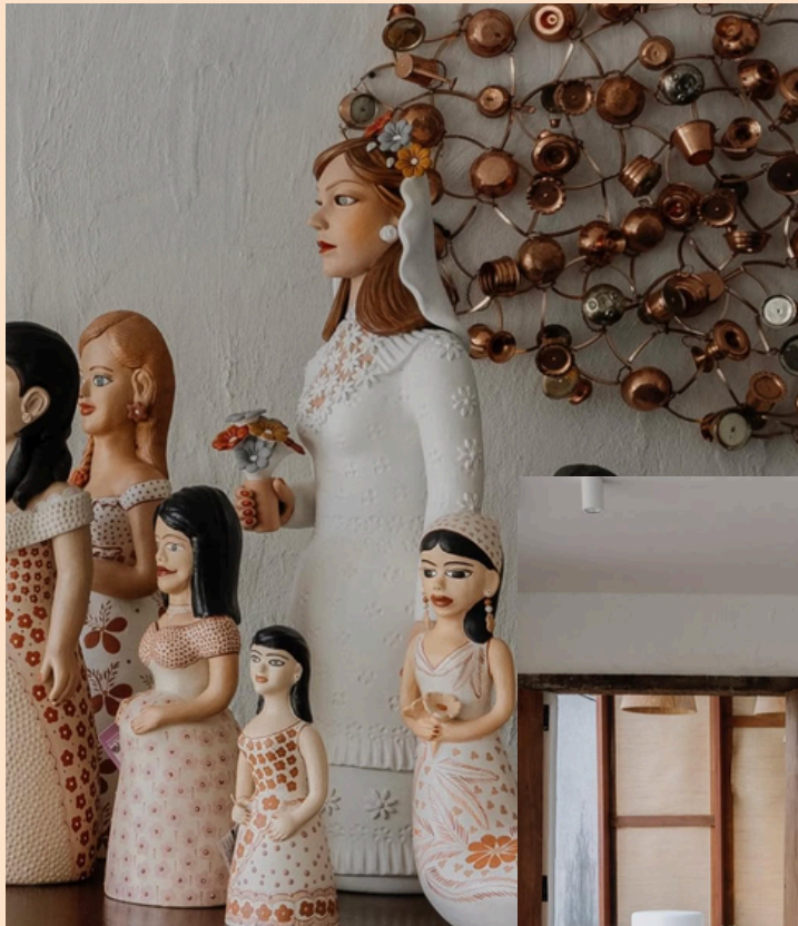
Belo Horizonte, MG